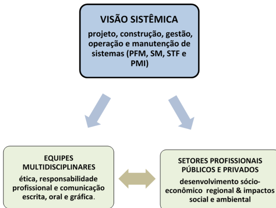
Figura 3 - Integração dos Objetivos do Curso