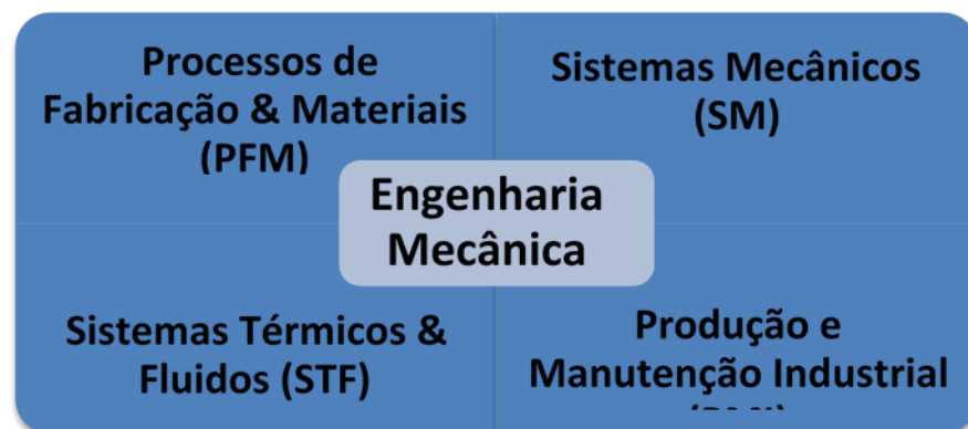
Figura 2 - Esquema de Classificação das Áreas da Engenharia Mecânica